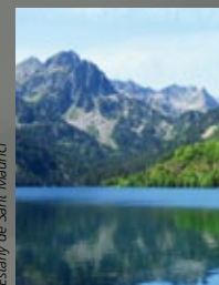
Estany de Sant Maurici

Vielha i Vall d'Aran: Artiga de Lin - Saint Bertrand de Comminges - Llac de Sant Maurici