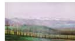
Pintura de Glòria Fornt

De l'1 al 15 Pere Huguet Pintura acrílica