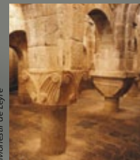
Monestir de Leyre

Sortida: 18 d'abril. Durada: 5 dies/4 nits.