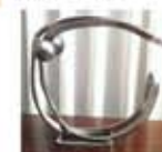
Escultura Enric Ripoll Espiau