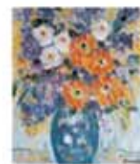
Pintura de Joana Sureda

A l'espai d'exposicions del COMB, planta baixa. Entrada gratuïta