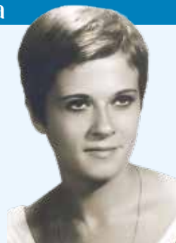
^ Retrat de la fitxa col·legial del CoMB, 1971.

Fou professora de la UB, on passà pels diferents estaments docents, fins a aconseguir per oposició la Càtedra de Microbiologia l’any 1988. Es va convertir en la primera dona catedràtica de la Facultat de Medicina d’aquesta Universitat. A l’àmbit de la recerca va desenvolupar una magnífica activitat en el camp dels bacteris Gram negatius multiresistents. Va participar en nombrosos projectes obtinguts en convocatòries competitives i va ser-ne, en molts d’ells, la investigadora principal.