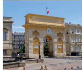
Viatges a Granada, Montpeller, Escòcia i Cantàbria, organitzats per Mediviatges per a la Secció de Metges Sèniors.