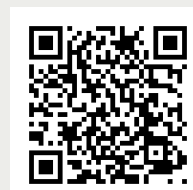
Guia Professional de Medicina Privada

A principis de novembre, el CoMB va acollir la jornada "Té futur la medicina privada?", un acte que va comptar amb l'assistència i la participació de més de dues-centes persones, representants de tots els agents implicats en aquest sector: metges, directius de companyies asseguradores i clíniques privades i de l'Administració pública.