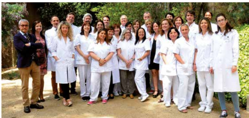
→ Equip de la Clínica Galatea.