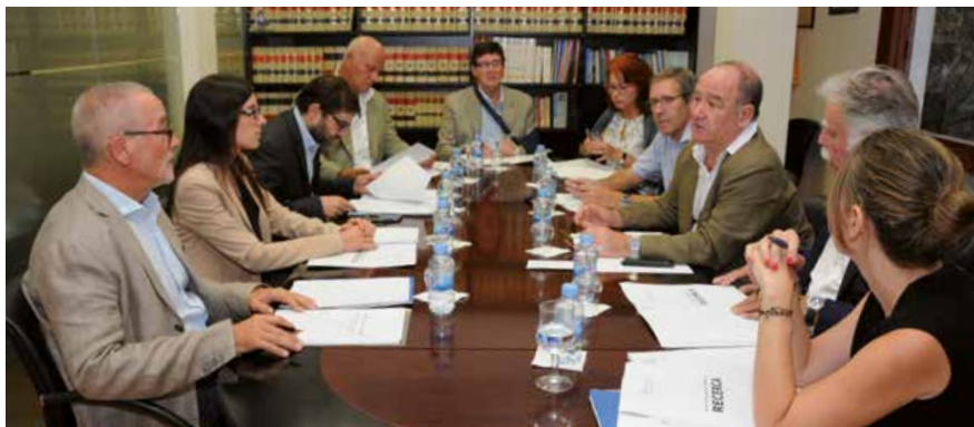
→ Membres del Comitè d'Ètica i d'Investigació Clínica.

La Direcció General d'Ordenació Professional i Regulació Sanitària del Departament de Salut va acreditar, l'agost de 2016, el nou Comitè d'Ètica d'Investigació Clínica (CEIC) del Col·legi de Metges de Barcelona.