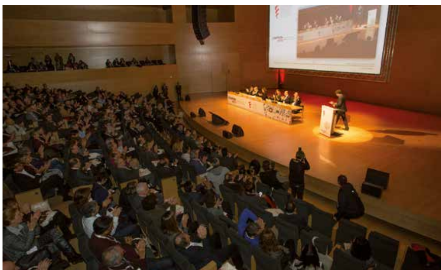
→ Acte inaugural del 3r Congrés de la Profesió Mèdica de Catalunya.

E l 3r Congrés de la Profesió Mèdica de Catalunya, celebrat el 10 de novembre de 2016, va reunir prop d'un miler de metges al Palau de Congressos de Girona amb l'objectiu de revisar quin model de metge volem davant dels canvis i els nous reptes que afronta la professió: la realitat demogràfica de la població i també del col·lectiu mèdic, la influència de les noves tecnologies de la informació i la comunicació (TIC), el canvi de rol dels pacients, la crisi econòmica i la precarietat pressupostària.