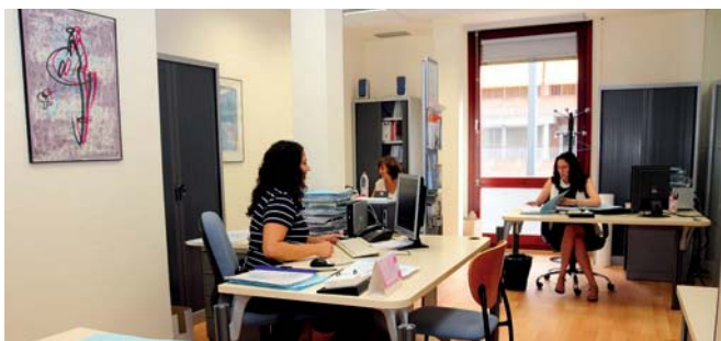
Àrea Ocupacional del COMB.

Més enllà de les ofertes de treball, el Servei d'Ocupació ofereix als col·legiats orientació en matèria laboral i professional, o sobre reorientació de carrera. També es facilita informació sobre la convocatòria MIR, així com sobre les possibilitats de fer l'especialitat o trobar feina a la Unió Europea i als Estats Units.