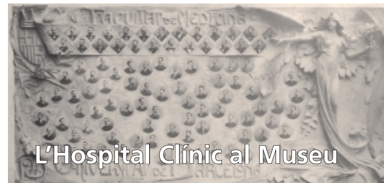
L'Hospital Clínic al Museu

Fundació Museu d'Història de la Medicina Espai d'exposició Pedro Pons del COMB (accés Pg. Bonanova) De juny a novembre de 2006