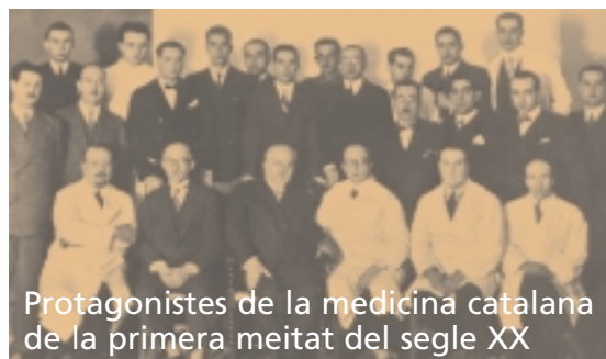
Protagonistes de la medicina catalana de la primera meitat del segle XX

Dia 25 La Festa del llibre Presentació de llibres no mèdics, escrits per metges. Conferència a càrrec de Feliu Formosa, Premi d'Honor de les Lletres Catalanes 2005: Poesia i traducció poètica A les 18 h Sala d'actes del COMB