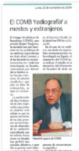
Diario Médico, 23 de novembre de 2009.

El Col·legi de Metges de Barcelona, conscient de la importància del nostre col·lectiu, ha sabut escoltar les nostres inquietuds i demandes i ens ha ofert el seu suport. Al llarg d'aquests darrers anys, s'han celebrat reunions periòdiques al COMB per definir estratègies i aportar solucions per a la integració professional, social, cultural i laboral d'aquests professionals a Catalunya. Van en aquest sentit iniciatives en l'àmbit de la formació, en àrees com l'accés a la professió o el millor coneixement de la llengua catalana, o en l'àmbit de l'orientació professional i social. Actualment s'està definint també la constitució d'una secció col·legial que ha de permetre que el conjunt de companys que estem en situacions semblants puguem treballar per trobar camins que donin resposta a les nostres inquietuds. Així doncs, s'ha de prendre consciència de la importància del col·lectiu de metges estrangers dins del món col·legial i sanitari. ■