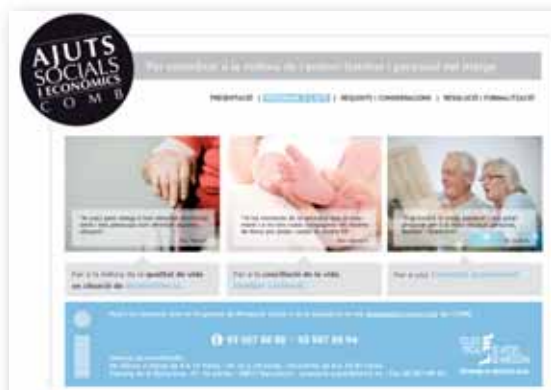
1 i 2. Imatges del web del Programa de Protecció Social del COMB a www.comb.cat .