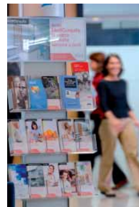
Medicorasse. Grup MED.