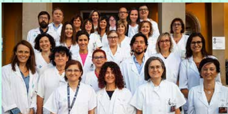
Servei d'Oftalmologia Hospital de Viladecans