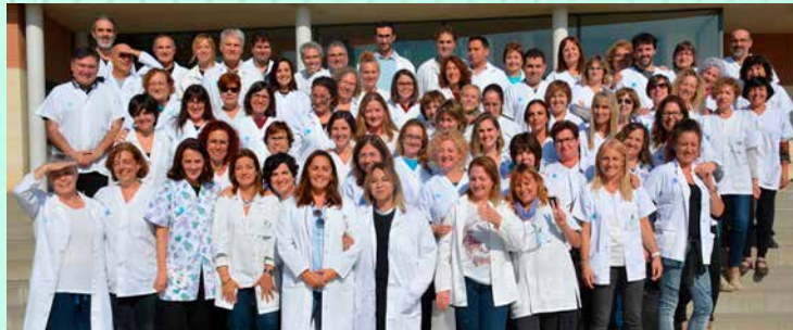
EAP Granollers Nord-Oest de l'ICS Equip Assistencial