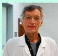
Candid Villanueva Sánchez Hospital de Sant Pau Aparell Digestiu