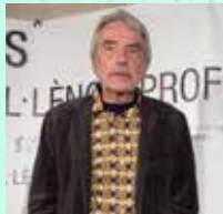
Josep Morera Prat Hospital Teknon i Hospital Cima/Sanitas. Hospital Germans Trias i Pujol (fins 2011) Pneumologia