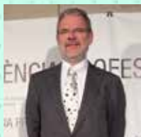
Antoni Gual Solé Hospital Clínic Psiquiatria