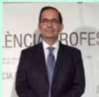
Pere Clavé Cívot Hospital de Mataró Cirurgia General i Digestiva