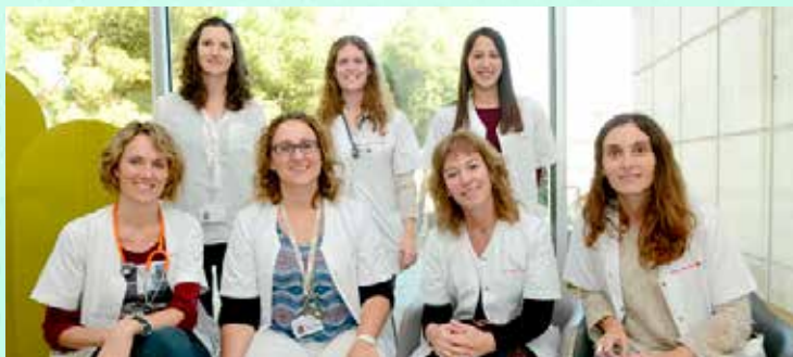
Unitat Funcional d'atenció als abusos sexuals a menors de l'Hospital Sant Joan de Déu