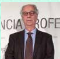
Eugeni Saigi Grau Hospital Universitari Parc Taulí, Sabadell, Assistència Sanitària Col·legial Oncologia Mèdica