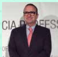
Antoni Soriano Arandes Hospital Vall d'Hebron Pediatría