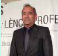
Josep M. Bausili Pons Hospital d'Igualada Anestesiologia i Reanimació