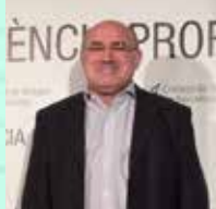
Josep Belda Sanchis Hospital Universitari Mútua Terrassa, Sabadell, Santa Creu i Sant Pau i Hospital del Mar Cirurgia Toràcica