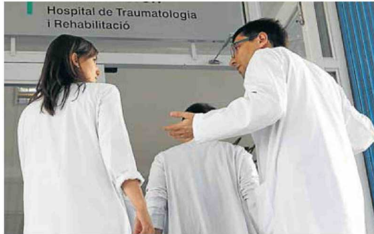
Les dones representen el 50% dels metges i són majoria a la Facultat de Medicina. C. ATSET

La conciliació no és només tenir cura de fills i pares. El 65% dels metges reconeixen dificultats per fer activitats d'oci, esportives o culturals, el 53% per compaginar la feina amb activitats socials i el 32% per, simplement, tenir una relació de parella. El COMB també sosté que la millora de la conciliació i de les condicions laborals repercutirà en positiu en l'atenció als pacients, ja que els professionals pateixen un "esgotament físic i psíquic" en feines de "gran responsabilitat". El president del Col·legi de Metges considera que no es pot exigir l'excel·lència del sistema sanitari si "es maltracta" els seus professionals, sobretot joves i ben formats, amb sous baixos i contractes temporals i precaris.