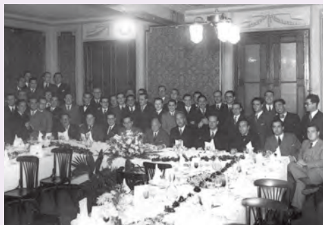
^ Reunió de la Societat Catalana de Pediatria i la Societat de Pediatria Espanyola, 1932.