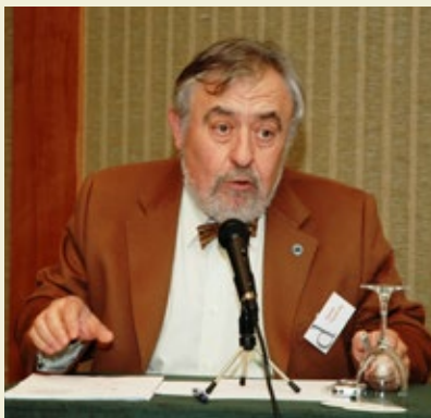
Celebració dels Cent cursos de la Fundació Rossend Carrasco i Formiguera, 2007